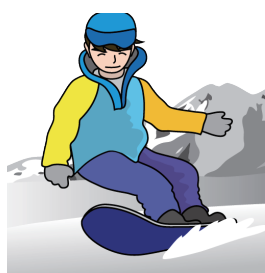
ウィンタースポーツに!